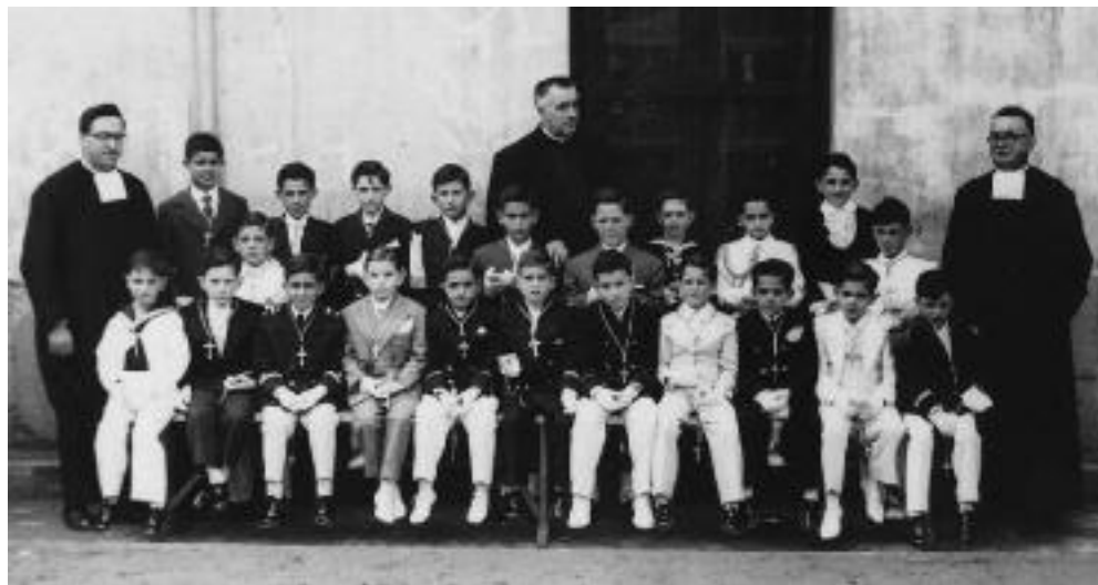
Grupo de niños Escuelas San Martín - 1956