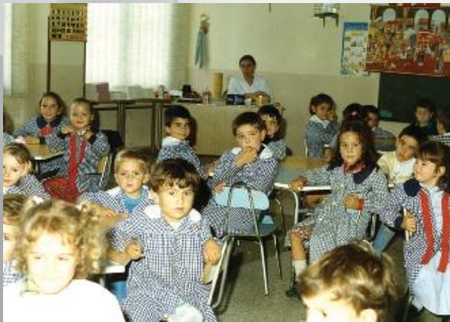
Años 80 aulas Colegio San Martín