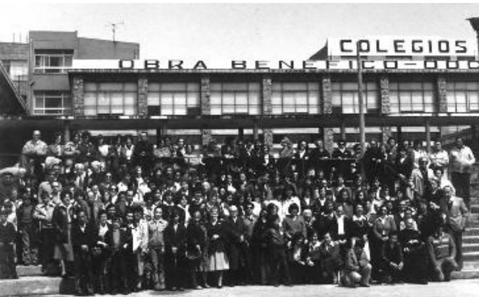
Reunión de delegados/as - Años 80